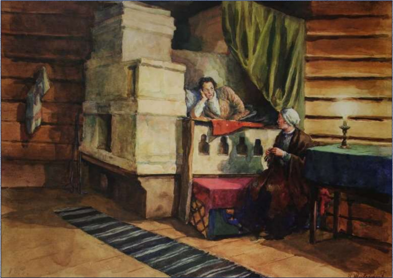
Пушкин и Арина Родионовна часто вместе коротали вечера. Няня усаживалась к столу со своими вечными чулками или с прялкой и под бойко бегающее в её руках веретено сказывала свои сказки – певуче, просто..., что, по свидетельствам самого поэта, получалось у нее превосходно.